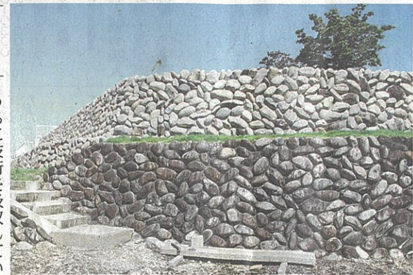
仲根さんが手がけた木曾玉石 積みの石垣。上段は昨年につ 造り、色味が違う下段は20年が 経過している=泉徳寺で

木曾玉石積み 木曾川流域で 採れる玉石を使った石積みの技 法。海拔の低い濃尾平野で水害による 被害を減らすため、土地のかさ上げに 用いられるなどして発展した。隣接す る石同士に必ず接点があり、現在は見 栄えのために隙間をモルタルで埋める が、なくても十分な強度を保つ。特徴 的な技法として交互に石を重ねる「網 代積み」、横の列を際立たせる「屋敷 積み」、亀の甲羅状にほぼ隙間なく積む最 高難易度の「亀甲積み」などがある。